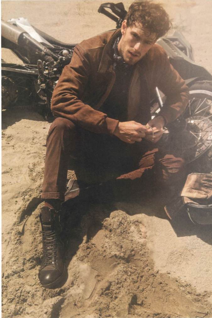
In questa pagina giacca Bomboogie, camicia e pantaloni Manuel Ritz, calze Borghesi Uomo e stiva: A.S. 90. Nella pagina a fianco giacca in pelle MRD giacca in denim Tel. Genova.